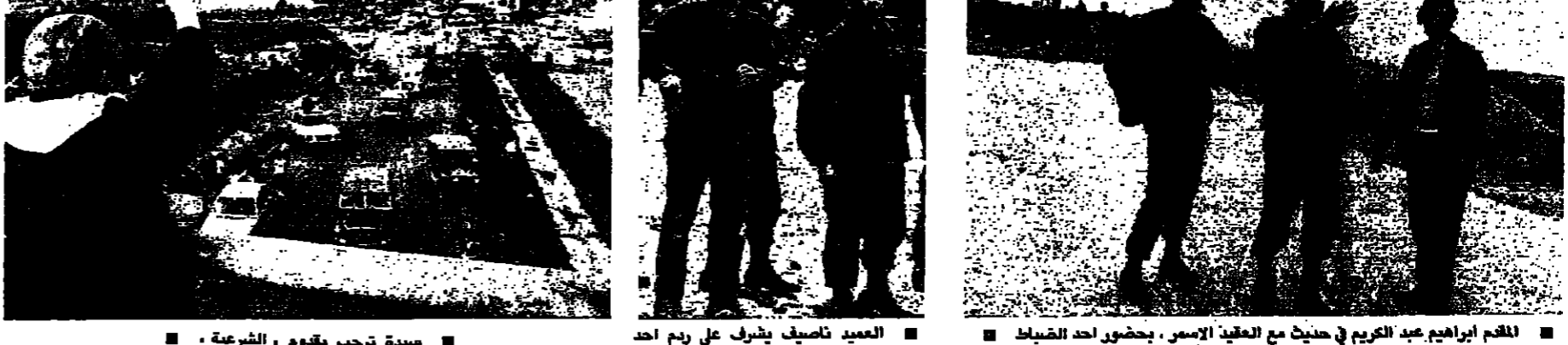
المعيد تصانيف يشرف على ردم أحد الخنادق

بشرت قوى الأمن الداخلي انتشارها المقرر على الطريق الساحلي والقيم الخروب بعد ظهر أمس وتوقعت مصادر أمنية أن تنجز قوى الأمن انتشارها في عمق الإقليم اليوم ما لم تظهر عوائق على أن تكون الطريق مهددة لتوسل الجيش اللبناني إلى منطقة الأولي خلال خمسة أيام. وتكرت مصادر رسمية أن تنفيذ خطة الانتشار على الساحل أعطلت الموقف اللبناني دفعا كان يتفاديه خلال المفاوضات العسكرية في الناقورة وعلى هذا الأسس تم مساء أمس اتصال هاتفي بين رئيس الجمهورية الشيخ أمين الجميل والأمين العام للأمم المتحدة السيد بييرز دي كويلار تناول مفاوضات الناقورة وضروورة إعطائها دفعا جديدا. وقد اتفق دي كويلار الرئيس الجميل أن يوفّر مساندة للفورون السياسية إرثان أوركلرته إلى المنطقة في نهاية هذا الأسبوع أو مع مطلع الأسبوع المقبل للبحث في تحريك الوضع المتعلق بالمفاوضات. وكانت لجنة الارتباط المحلية القديم الحروب والطريق الساحلي، قد اجتمعت صباح أمس، وأقرت خطة